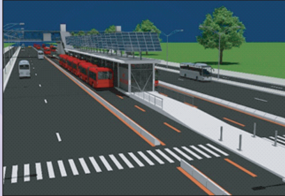
ডেডিকেটেড বাস লেইন ও বাস স্টেশন (এনিমেটেড)