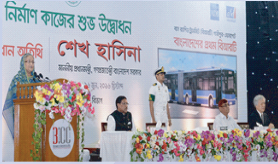
বিআরটি নির্মাণ কাজের উদ্বোধন করেন বাংলাদেশ সরকারের মাননীয় প্রধানমন্ত্রী শেখ হাসিনা